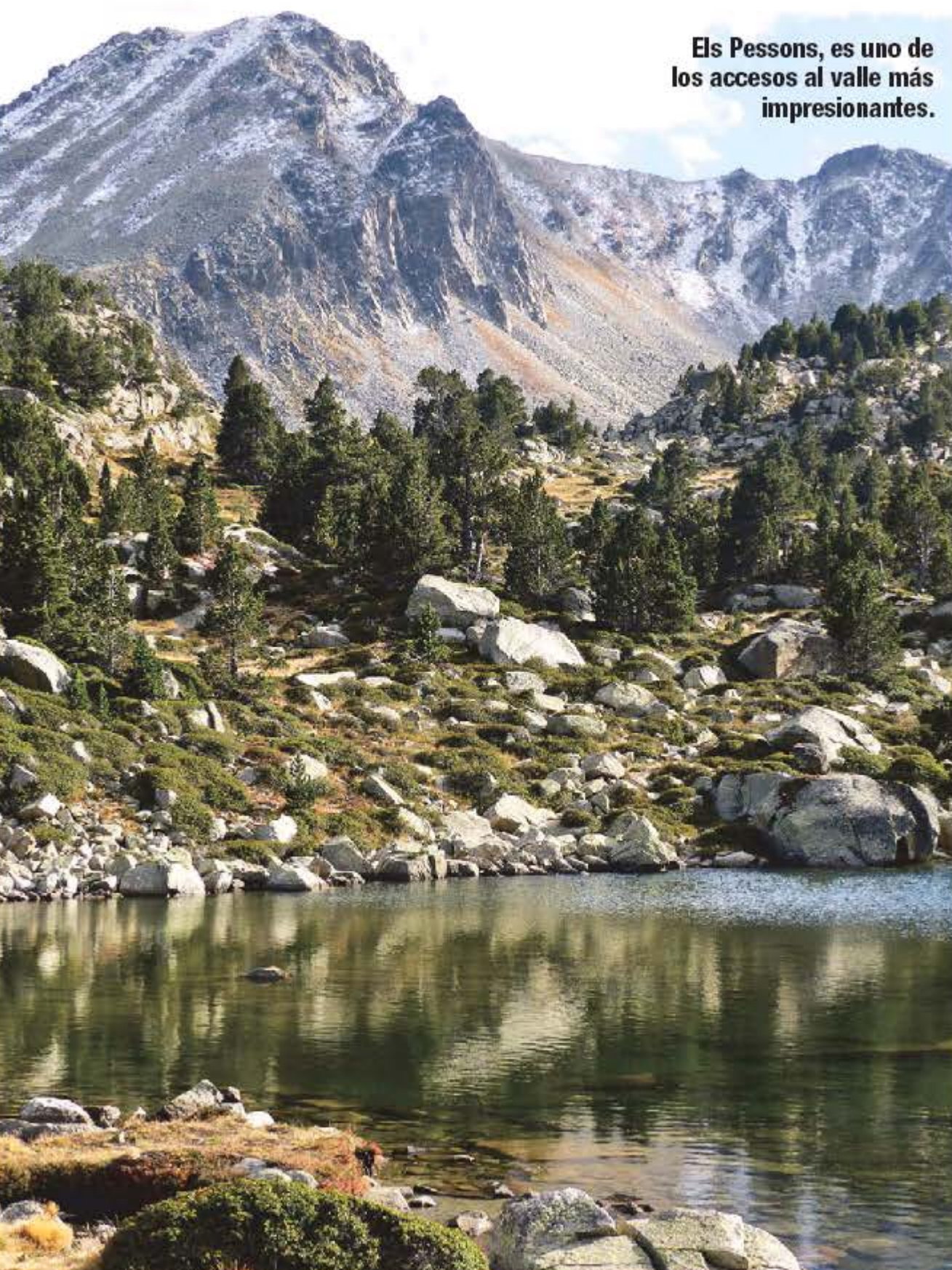
Els Pessons, es uno de los accesos al valle más impresionantes.

encontramos el pico Padern ( Patemu ). Tenemos varios puntos de acceso, siendo el más habitual la entrada al valle por Escaldes, pero sin duda es muy recomendable acceder por los lagos de Pessons, cerca de El Pas de la Casa, un rosario de lagos que parecen estar pintados en un lienzo, por los que tras recorrerlos en su totalidad, accederemos al valle por su parte más alta, por el collado de Pessons, a 2.775 metros de altura. También tenemos la posibilidad de acceder por la Cerdanya catalana, a través del collado de Vallcivera, a 2.517 metros, ascendiendo por el impresionante valle de La Llosa, un valle que utilizaron en el siglo XXII y XXIII los Cátaros del Languedoc francés, en su huida tras las acusaciones