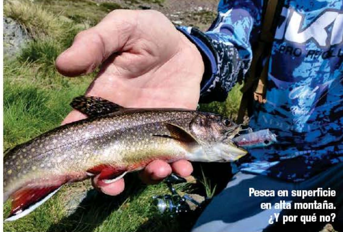
Pesca en superficie en alta montaña. ¿Y por qué no?

A hora que la temporada de alta montaña está por llegar, es un buen momento para hacer balance de la temporada pasada, de marcar en rojo los lugares que deseamos visitar los próximos meses, de rememorar anteriores salidas para hacer más llevadera la espera. Una buena conversación entre pescadores trucheros, al calor de una chimenea con una agradable taza de café caliente es inspiradora y también es “pescar”, disfrutando de nuestras aventuras tras las pintonas, haciendo planes futuros... En definitiva, seguimos soñando. La pesca de salvajes farios y combativos salvelinos en aguas de alta montaña no está al alcance de cualquiera, pero si estamos en buena forma física y queremos pasar jornadas para recordar, vale mucho la pena perderse por los riachuelos y lagos de más altura para pescar en completa soledad, con peces de calidad. El Pirineo es ideal para ello, con rincones de ensueño a más de 2.000 metros de altitud, y en esta ocasión hablaremos de la pesca en una de las zonas más hermosas de Andorra, “el país de los Pirineos”, que me ha dado grandes jornadas pasadas... ¡Contando las horas para volver de nuevo!