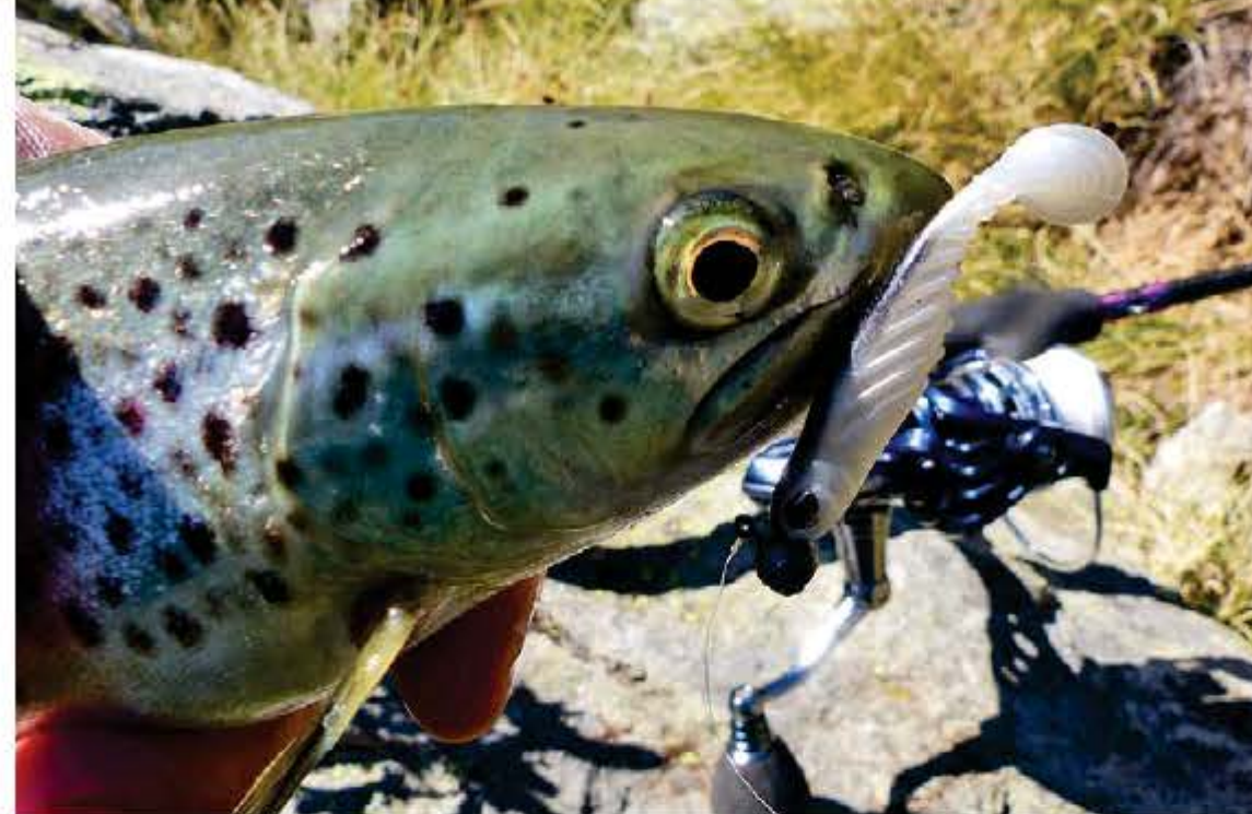
Los pequeños vinilos también tienen su momento en estas aguas trucheras.

vez mayor para unas aguas de escaso tamaño, por lo que se han efectuado repoblaciones con ejemplares de talla de origen centroeuropeo y en muy escasas ocasiones con alevines de fario, práctica ésta que debería ser la más habitual. Esperemos que las cosas cambien. En los lagos andorranos encontramos trucha de origen centroeuropeo repoblada y fario, tanto endémicas como de repoblaciones con alevines, teniendo en cuenta que en muchas ocasiones la hibridación hace que encontremos truchas muy bonitas, difíciles de distinguir. En todo caso, desde luego en los lagos podemos hacernos con unos increíbles y peleones ejemplares, sanos como pocos, que nos brindarán aparte de buenas peleas, grandes momentos plasmados en fotografías y vídeos.