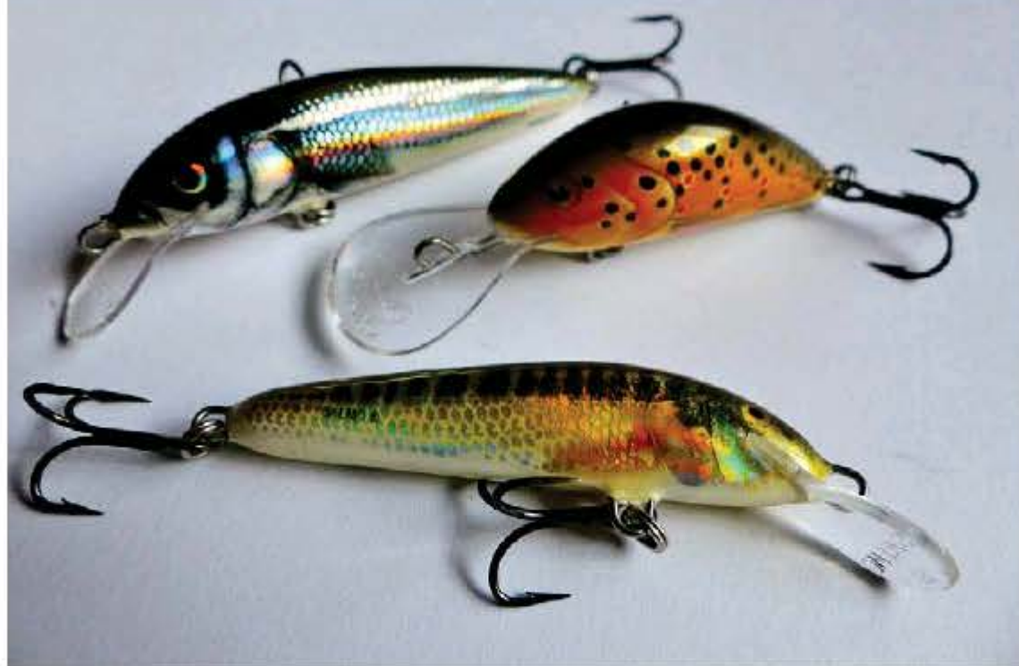
La firma Salmo dispone de coloraciones espectaculares y muy efectivas para los salmónidos en estos entornos.